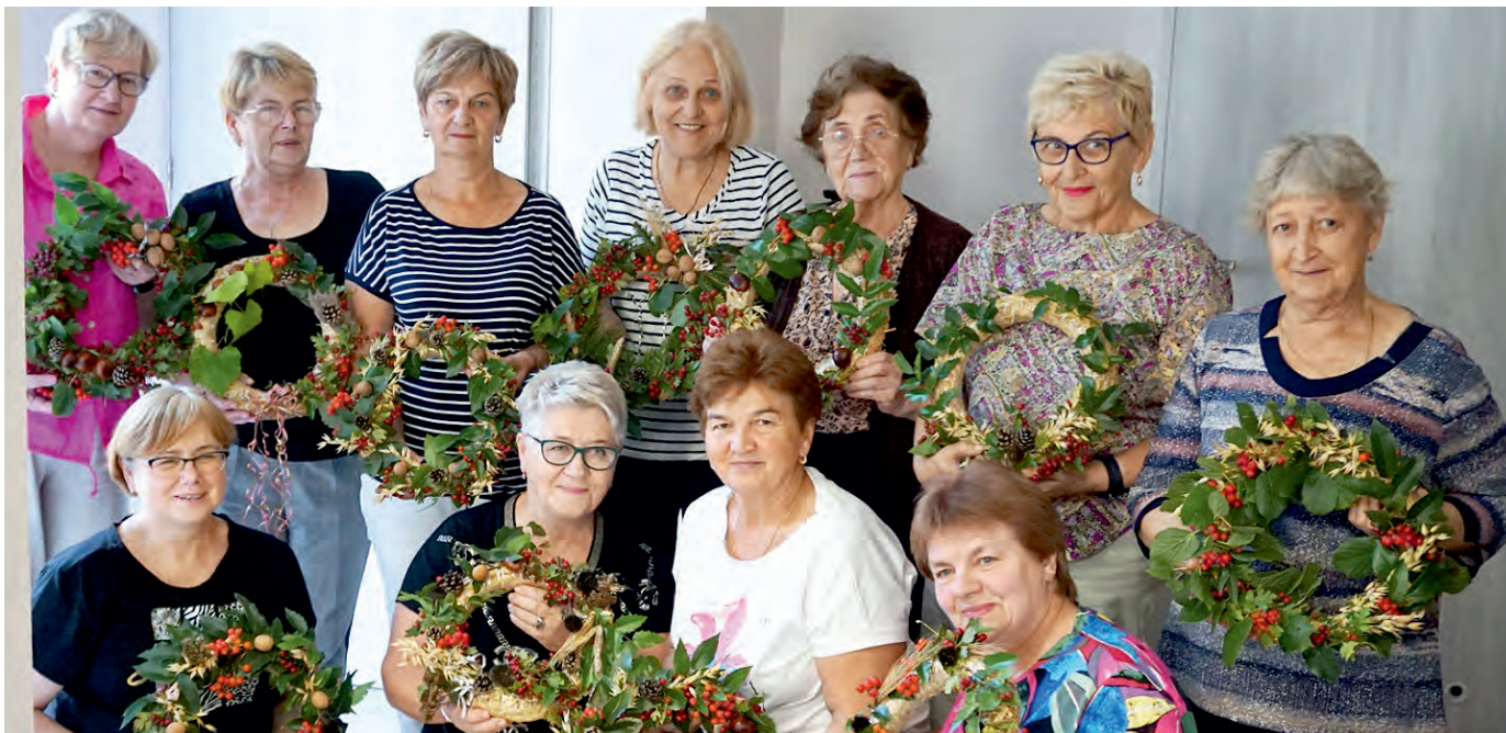
Projekt adresowany jest do mieszkańców Elku i terenów przygranicznych. Fundacyjni trenerzy docierają aż na krańce powiatów węgorzewskiego i gołdapskiego. Działania dofinansowują Fundusze Europejskie dla Warmii i Mazur. Na zdjęciu uczestniczki z Budry z własnoręcznie zrobionymi wieńcami.