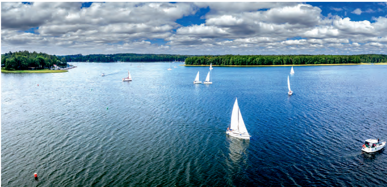
Sektor Mikro, Małych, Średnich Przedsiębiorstw (MŚP) to filar rozwoju gospodarki, także na Warmii i Mazurach.

Szkolenia pozwolą pracownikom fundacji doskonalić pracę zespołową i komunikację międzykulturową, a ponadto – efektywniej wykorzystywać nowoczesne narzędzia ICT. Fundacja Wsparcia Nauki i Biznesu prowadzi w Ełku trzy szkoły dla dorosłych. Poznanie europejskich standardów nauczania wpłynie na jakość realizowanych w placówkach szkoleń, kursów i warsztatów. Dużą zaletą programu Erasmus+ jest nacisk kładziony na wzmacnianie kompetencji językowych. Płynna znajomość języka angielskiego ułatwia nawiązywanie współpracy z organizacjami pozarządowymi z innych państw, udział w konferencjach i dostęp do najnowszych opracowań.