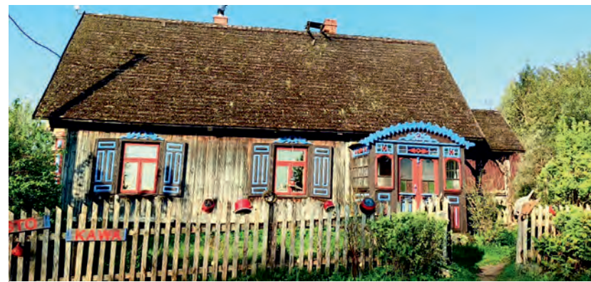
Malownicza Buda Ruska.

Malczewskiego, udowodnił, że są to bez wątpienia magiczne zakątki kraju, które składają się na całościowy obraz jego wysuniętych na wschód terenów. Wydarzenie było o tyle wyjątkowe, że festiwal w Budzie Ruskiej świętował 10. urodziny. I mimo zlokalizowania w niewielkiej wsi nad Czarną Hańczą, ponownie przyciągnął setki osób poszukujących literatury, ciekawych spotkań i rozmów na łonie natury.