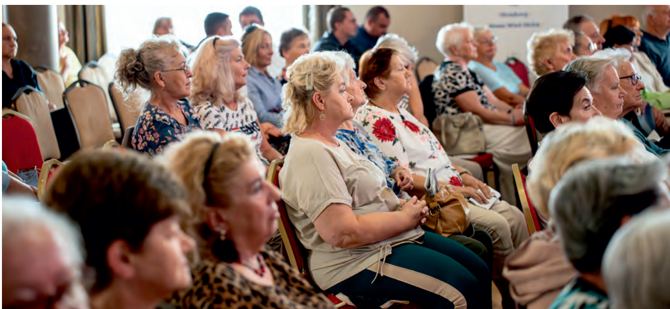
Partnerami konferencji byli: Szpital Miejski „Pro-Medica” w Elku, elckie Stowarzyszenie „Amazonki” oraz Polski Związek Emerytów, Rencistów i Inwalidów Oddział Rejonowy w Elku, który jest jedną z najliczniejszych organizacji skupiających seniorów z terenu naszego miasta.