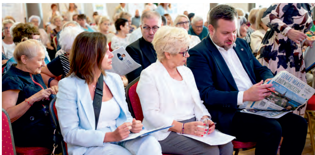
Konferencji patronowali Marszałek Województwa Warmińsko-Mazurskiego i Prezydent Ełku.